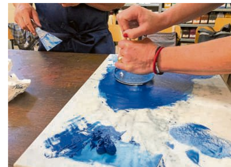
... bis sich das Leinöl mit dem Pigment geschmeidig verbindet.“