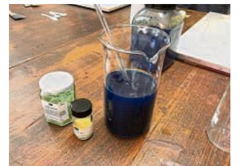
„Gekocht wird manchmal auch.“