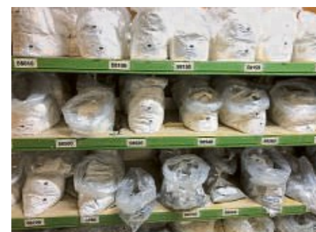
„Die Kunst ist Sache der Kundschaft.“