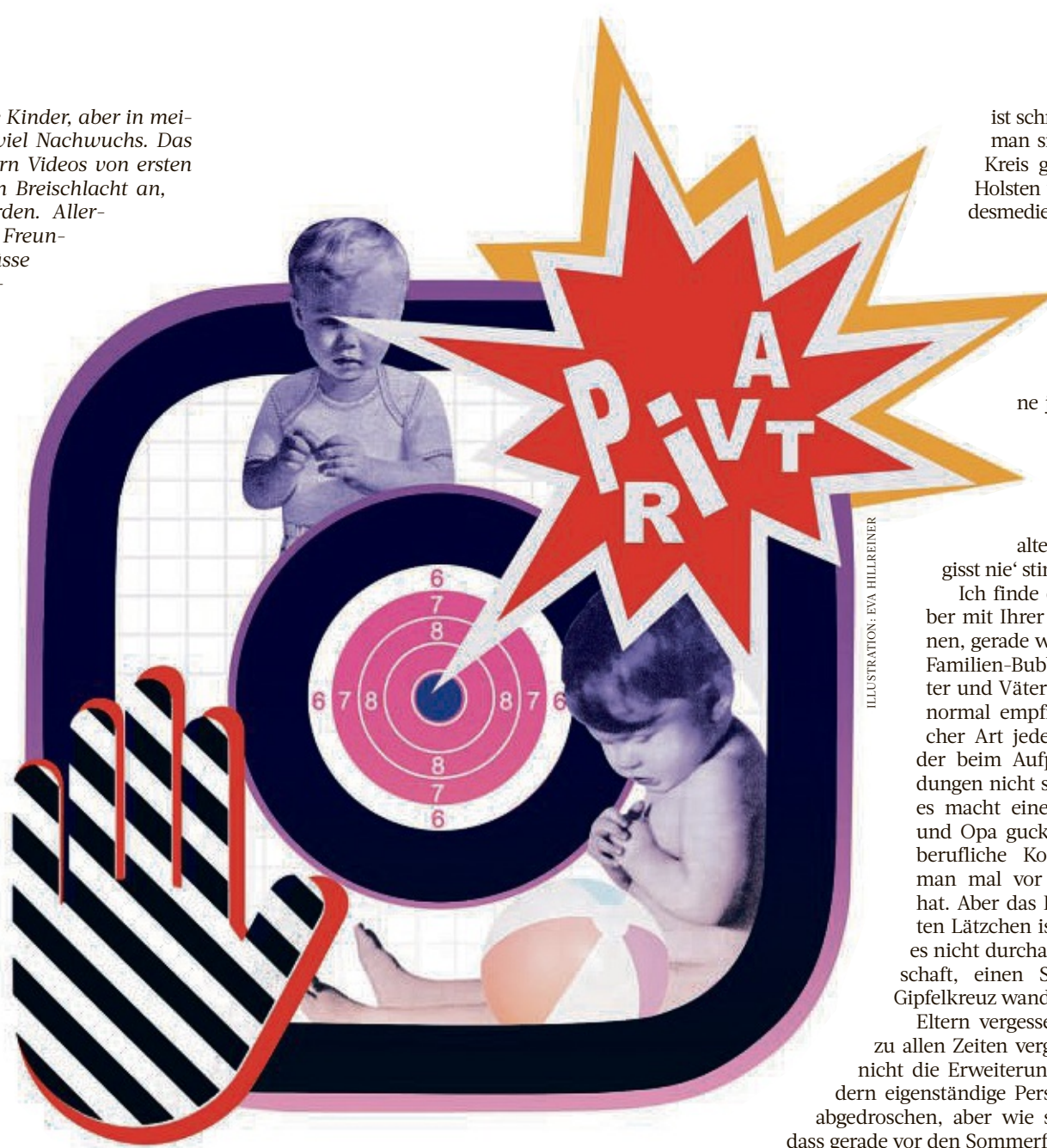
ILLUSTRATION: EVA HILLREINER

„Es kann sehr schnell passieren, dass diese Bilder in allen möglichen Ecken des Internets landen. Ein Screenshot