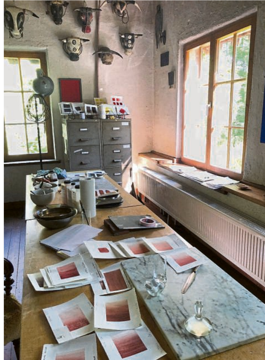
„Der Gedanke, in Vergessenheit geratene Schätze zu bewahren, ist überall erkennbar.“