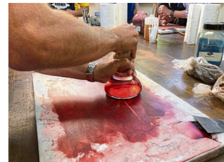
„Mit dem Glaskolben wird die Masse auf einer Steinplatte verrieben ...“