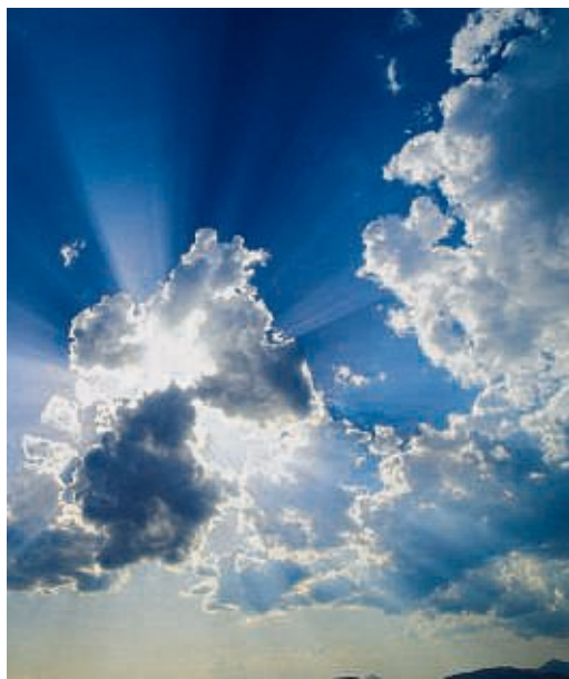
So haben wir Beschattungen gern.