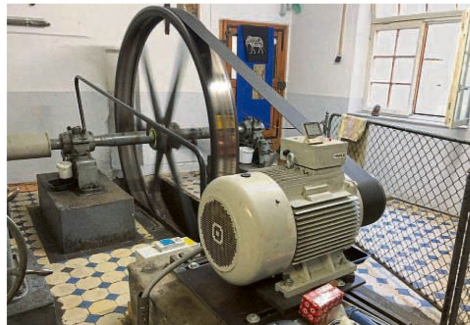
„Wo einst der Müller das Korn mahlte, rattert ein Wasserkraftwerk.“