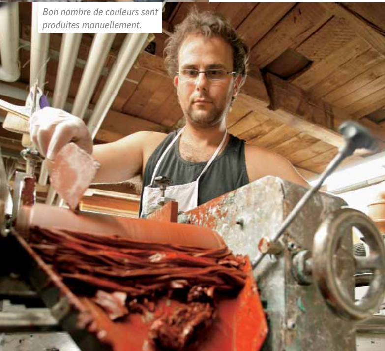
Bon nombre de couleurs sont produites manuellement.