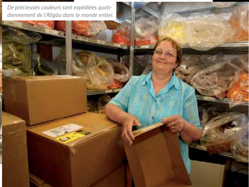
De précieuses couleurs sont expédiées quotidiennement de l'Allgäu dans le monde entier.

et ce, bien qu'on ne la trouve qu'en plein milieu d'une zone militaire tchèque dans laquelle il n'a pas le droit de pénétrer personnellement jusqu'à ce jour. Il préfère donc ne pas révéler la manière dont il a malgré tout pu se la procurer, car une chose est sûre : suite à la longue recherche d'un accès à cette matière première, ce vert lui tient tout particulièrement à cœur. « C'est l'une de mes couleurs préférées, même s'il y en a beaucoup d'autres. Car Mère Nature a tout simplement beaucoup de belles filles », dit-il avec sagesse.