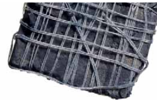
Connus depuis des siècles comme pigments : Indigo et laque en grains.

Que ce soit sur les murs et les autels des vieilles églises ou sur les toiles des grands maîtres : les couleurs naturelles y déploient leur intensité lumineuse unique et fascinante. Leurs recettes étaient déjà tombées dans l'oubli, mais un chimiste allemand a entre-temps redécouvert les pigments historiques.