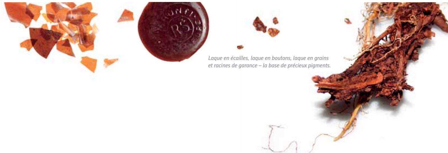
Laque en écailles, laque en boutons, laque en grains et racines de garance – la base de précieux pigments.

Le rouge le plus cher et l'un des plus vieux pigments qui soit est en revanche le cinabre. « Nous achetons des morceaux de ce minéral extrêmement rare par l'intermédiaire du ministère de la santé d'une province chinoise, car le cinabre contient du mercure, et le mercure est considéré comme propice à la santé en Chine », raconte le coloriste souabe. Il brille de son rouge saturé, par exemple, sur le célèbre retable d'Isenheim de Matthias Grünewald à Colmar, en Alsace, et est encore très prisé de nos jours, car il ne coûte « que » deux euros