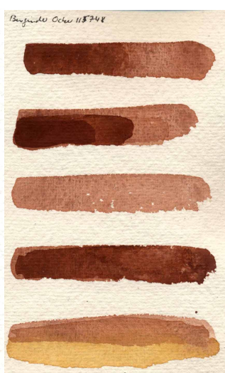
Papier chiffon de coton