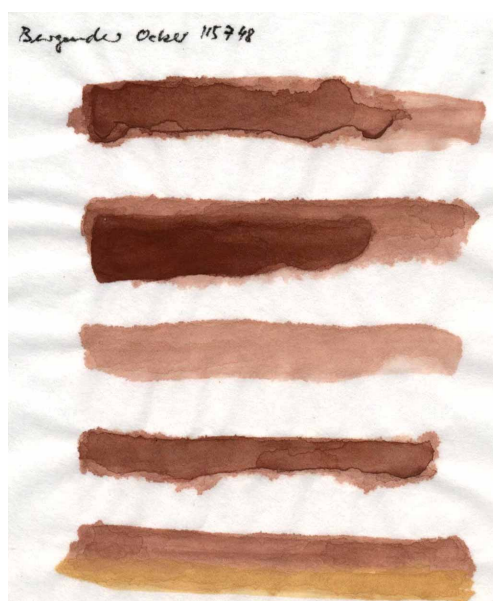
Papier de riz chinois