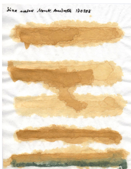
Papier de riz chinois