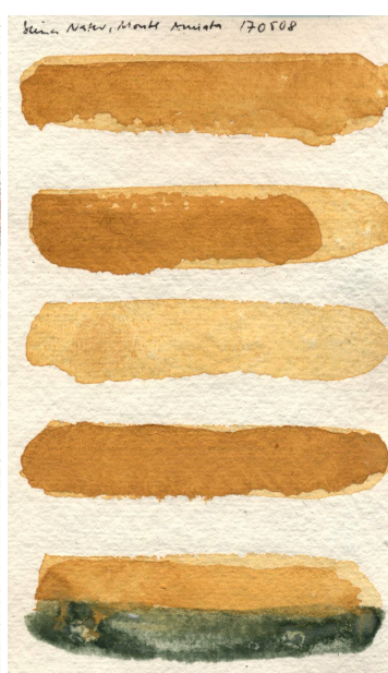
Papier chiffon de coton