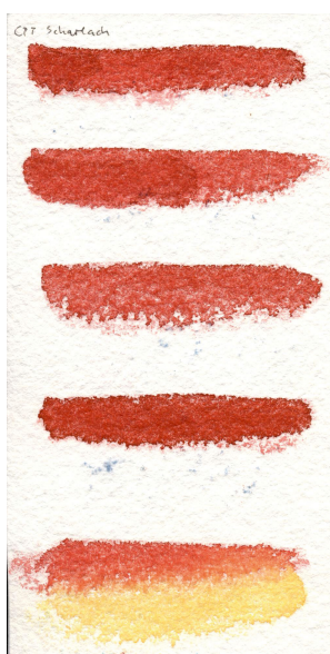
Papier fait à la main