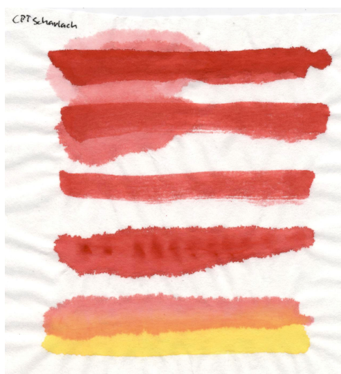
Papier de riz chinois