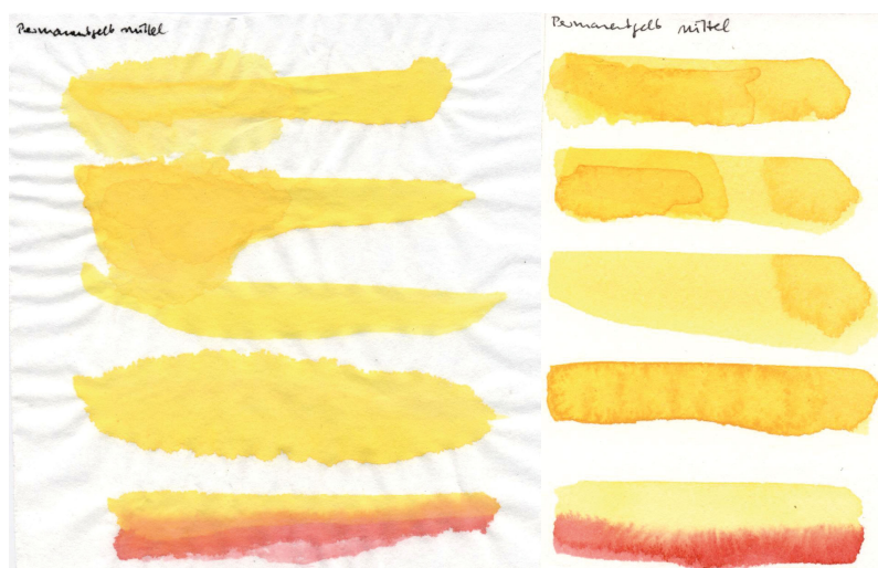
Papier pressé à chaud