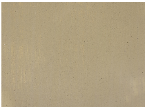
40241 Rehbraun (50 g / 1 kg)