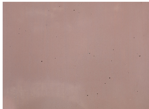
40510 Venetianischrot (50 g / 1 kg)