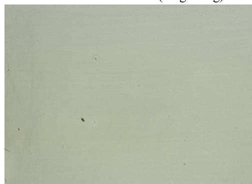
40830 Grünerde, französisch (50 g / 1 kg)