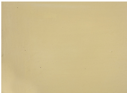
40220 Goldocker italienisch (50 g / 1 kg)