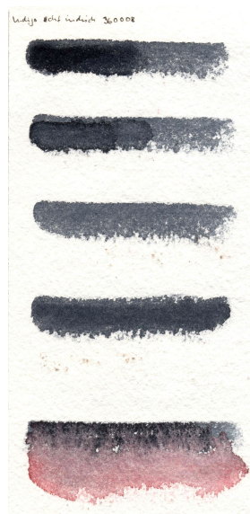
Cotton Rag Papier