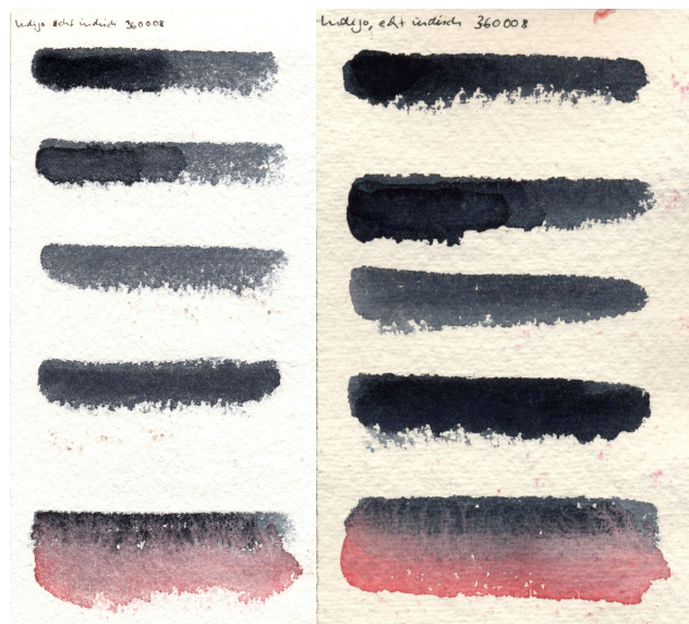
Papier de riz chinois