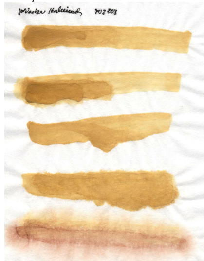
Papier de riz chinois