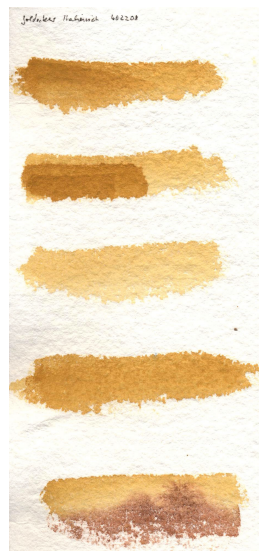
Papier fait à la main