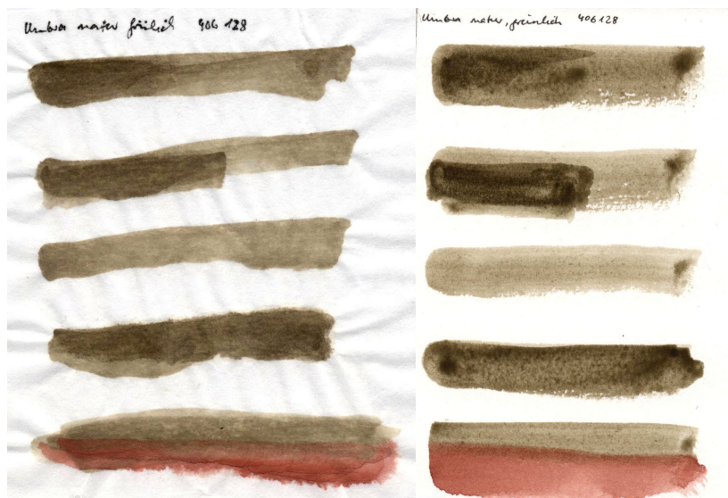
Papier pressé à chaud