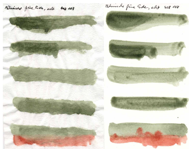
Papier pressé à chaud