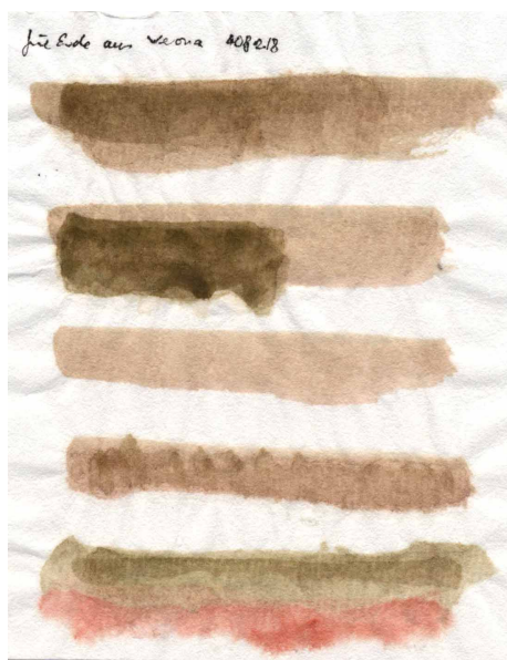
Papier de riz chinois