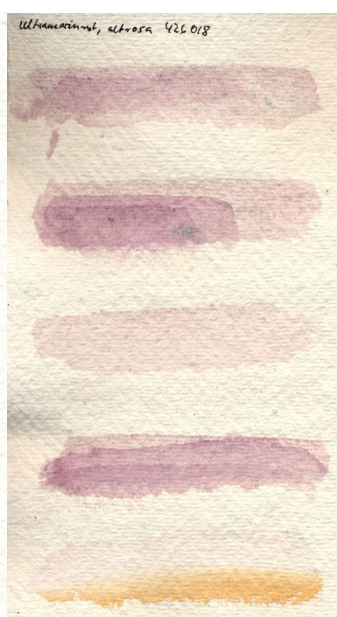
Papier chiffon de coton