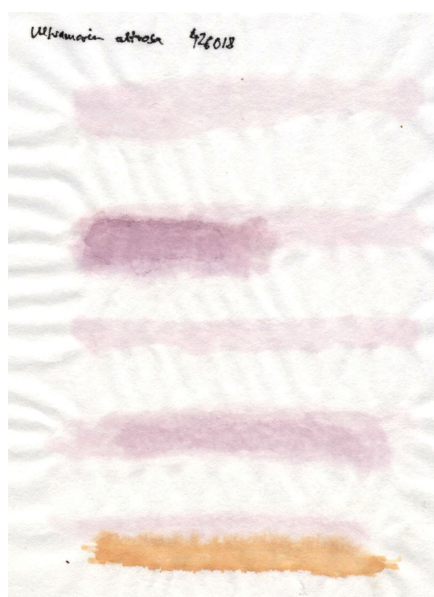
Papier de riz chinois