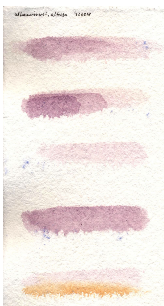
Papier fait à la main