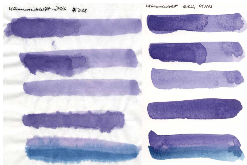
Papier pressé à chaud