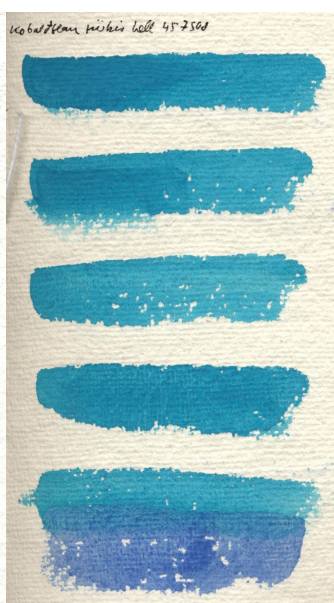
Papier chiffon de coton