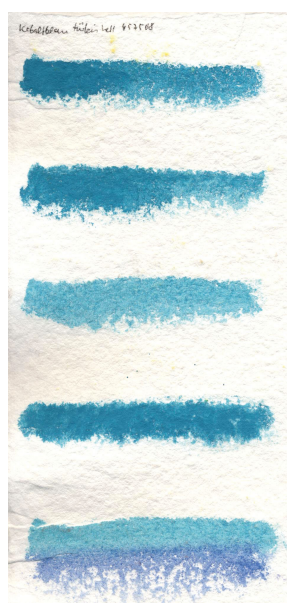
Papier fait à la main