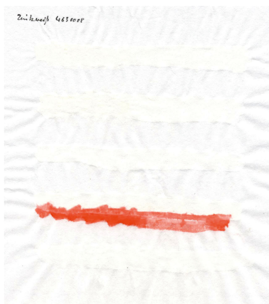
Papier de riz chinois