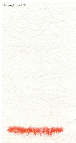
Papier fait à la main