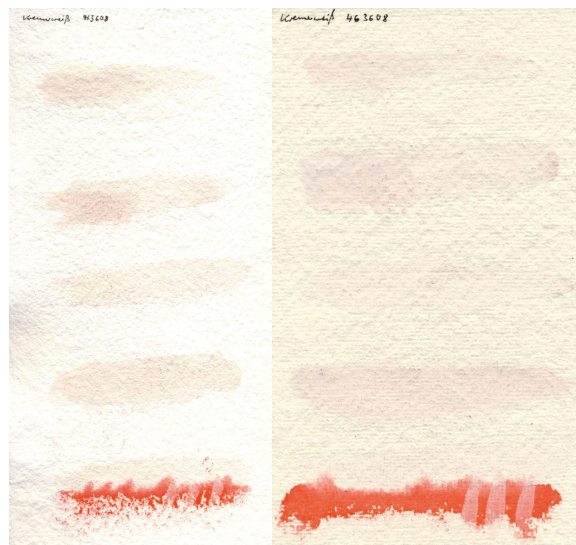
Papier de riz chinois