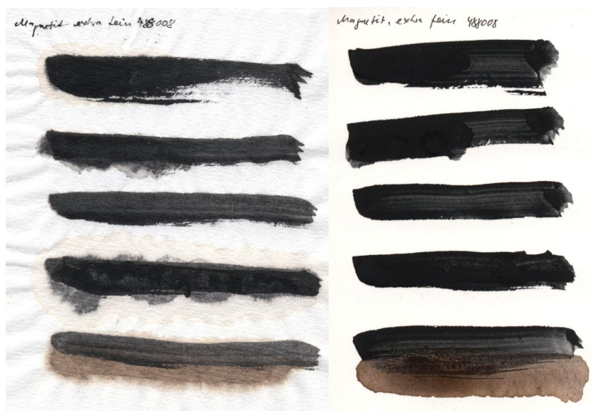
Papier pressé à chaud