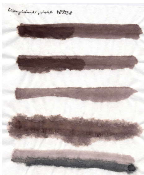
Papier de riz chinois