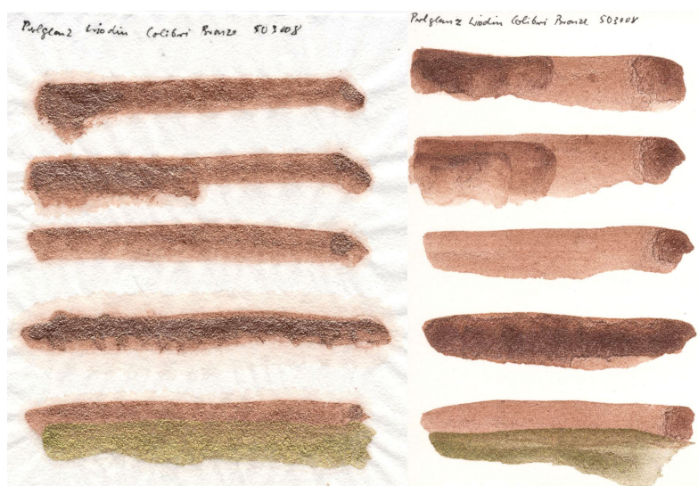
Papier pressé à chaud